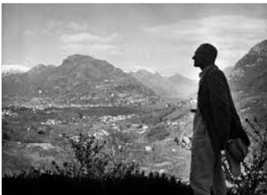
Hermann Hesse, Passeggiata sul lago di Como , 1913.

Nel sogno di cui vi dicevo ad un certo punto è comparso Hermann Hesse, premio Nobel per la letteratura nel 1946 e fra i più appassionati cantori, cantore anche critico, del nostro paesaggio. Nell'immagine lo vedete stagiarsi con un paesaggio sullo sfondo che ben conosciamo, ma l'originalissima riflessione che potete leggere sotto riguarda soprattutto il lago di Como, la più svizzera delle città italiane. Un confronto che ci fa riflettere.