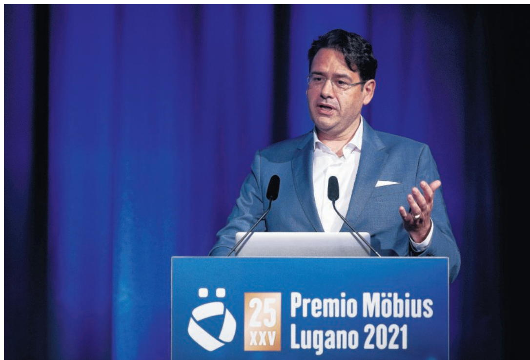
La start up ha ricevuto un riconoscimento speciale per il 25° del Möbius